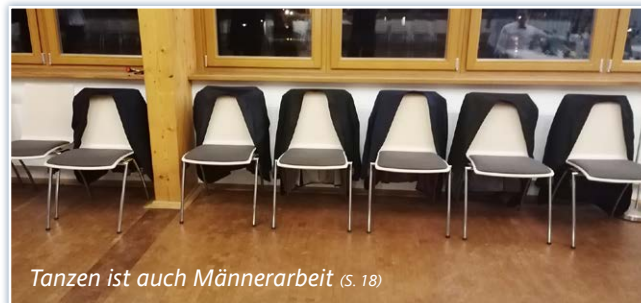
Tanzen ist auch Männerarbeit (s. 18)